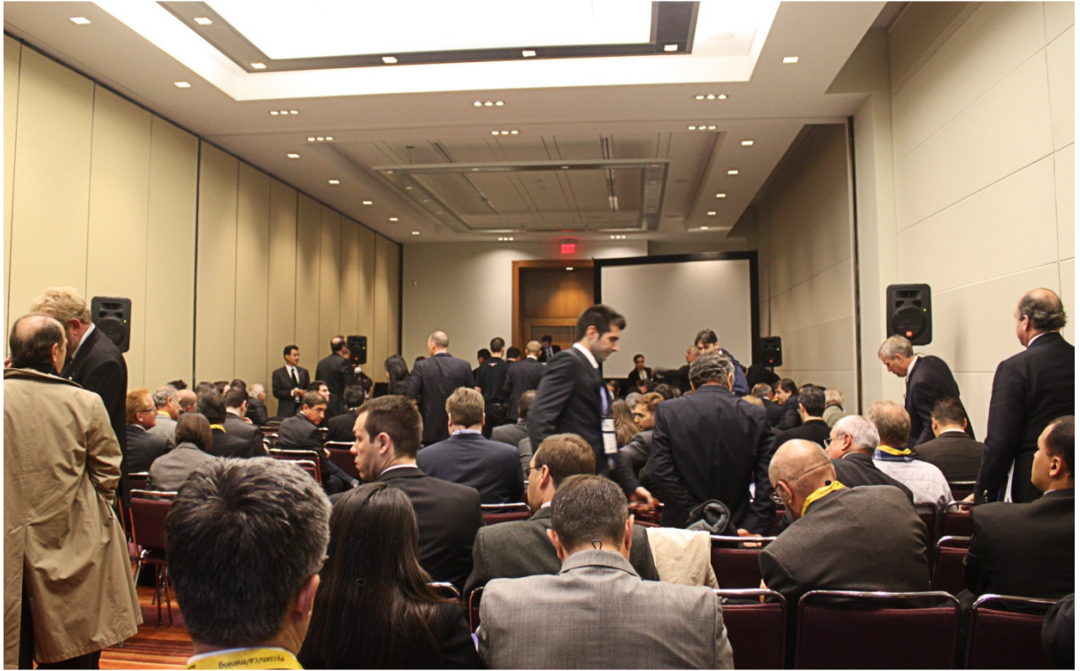
Preparação para o Brazilian Mining Day