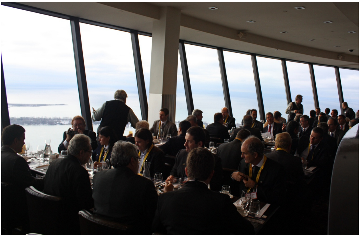
Café da manhã da missão Brasileira no alto da CN Tower