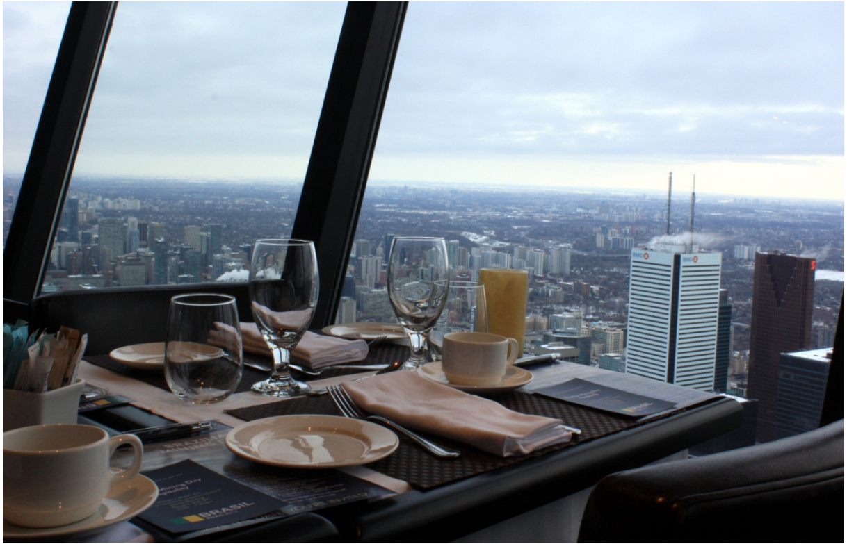
Vista da cidade de Toronto do alto da CN Tower