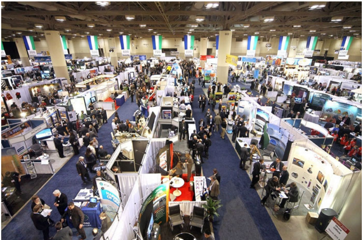
Visão Geral do Trade Show

A edição de 2013 da conferência anual da Prospectors and Developers Association of Canada reuniu 30.147 pessoas de 126 países que circularam nos espaços de exposição, salas de seminários, workshops e reuniões do Metro Convention Centre de Toronto.