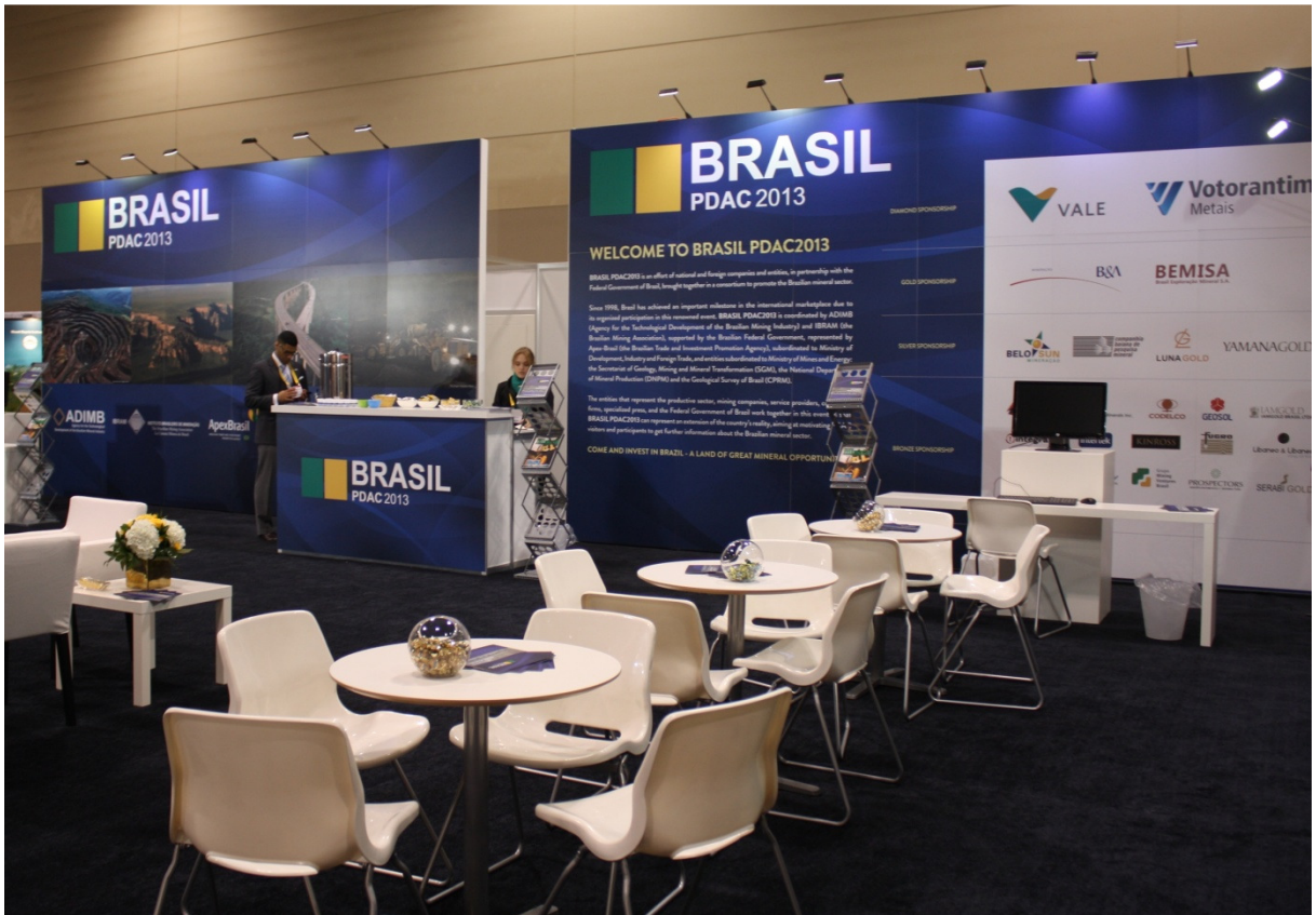
Estande Brasil PDAC2013