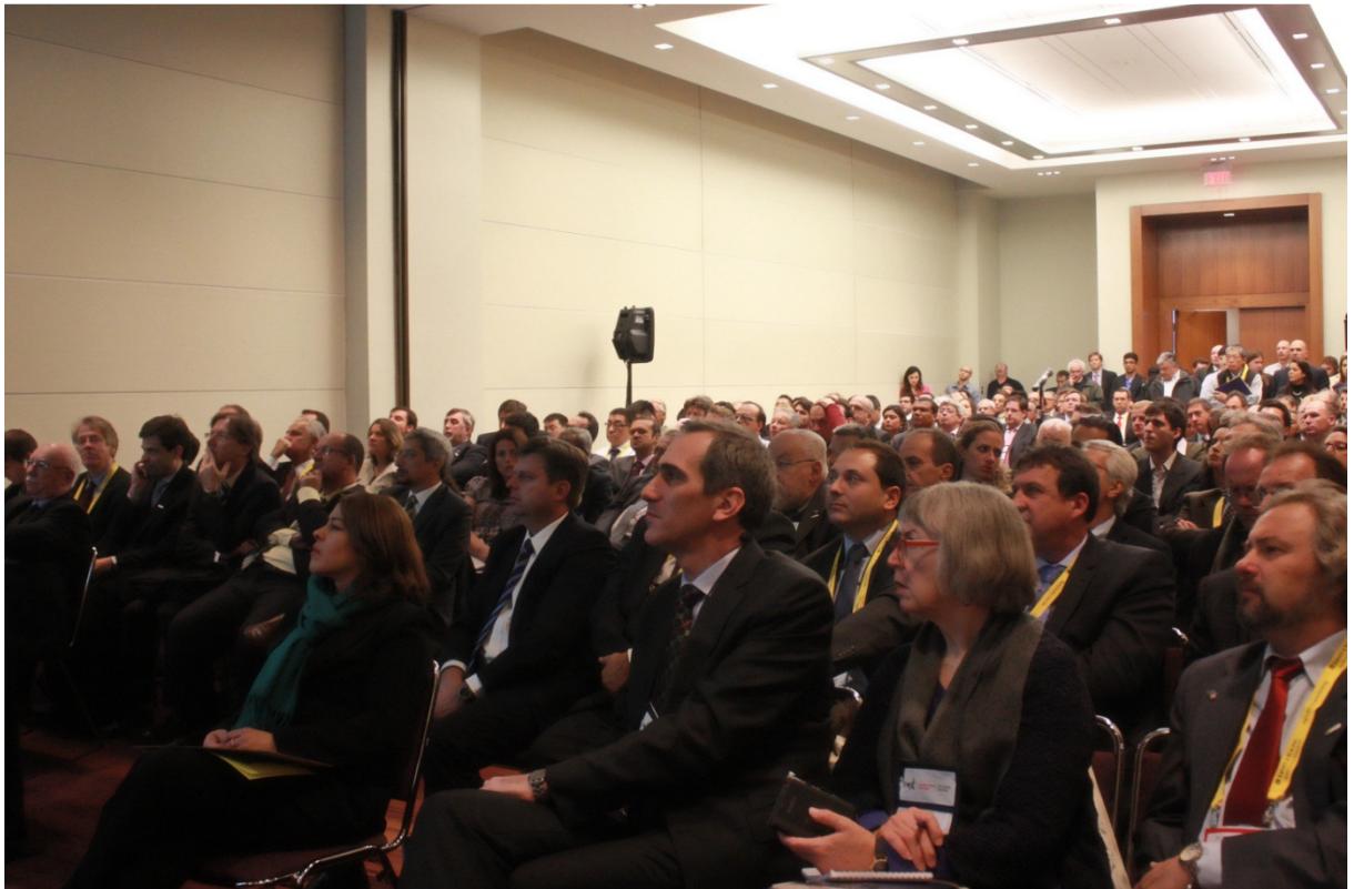
Audiência no Brazilian Mining Day